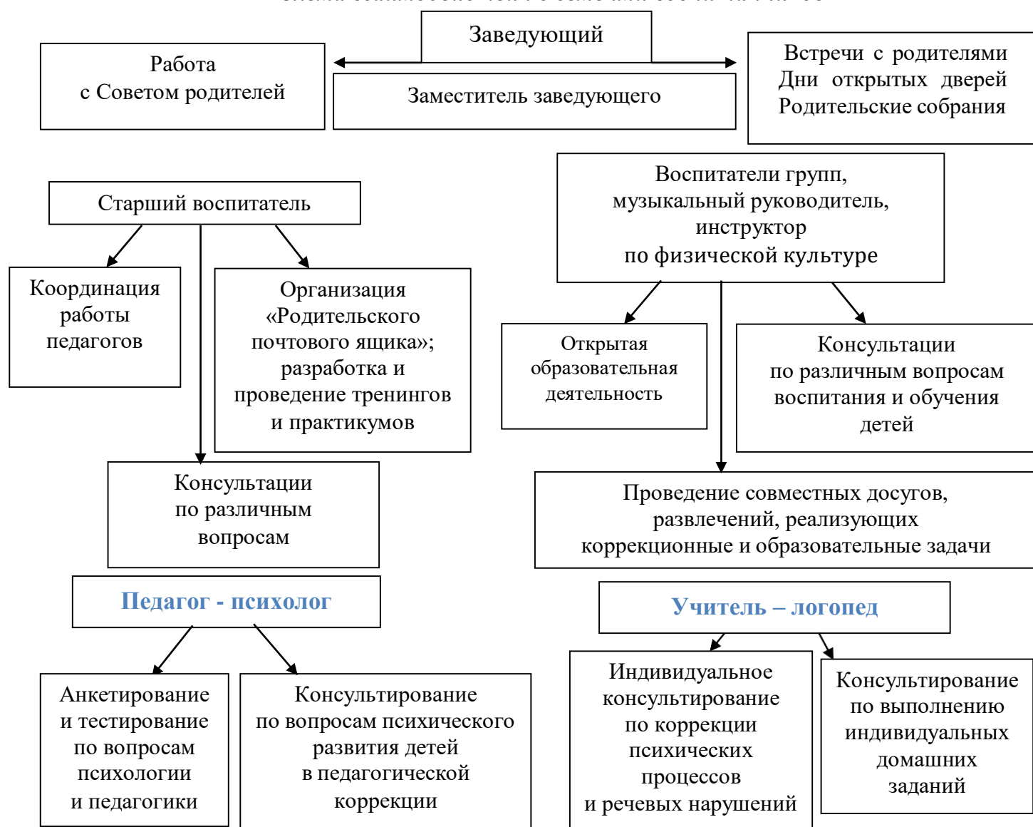
Рис. 1 «Схема взаимодействия с семьями воспитанников»